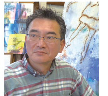
出射 茂 (画家) 東京藝術大学美術学部絵画科卒業。同大学院修了。「上野の森美術館大賞展」優秀賞、「三浦美術館大賞展」大賞他、受賞多数。国内、ニューヨーク、上海でも個展を中心に活動。