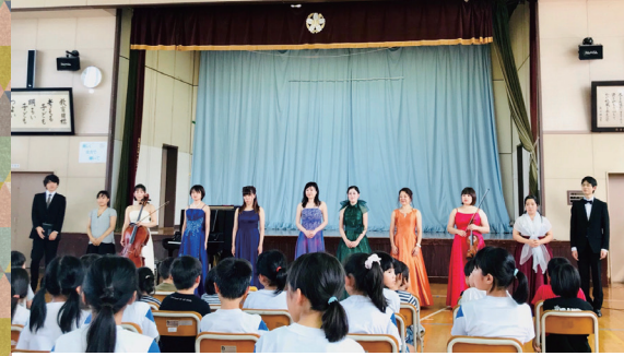
▲スクールコンサート

二つ目は、音楽以外の習い事を必修科目として町のご協力で実施できたことです。フラダンス、蕎麦打ち、パン作り、生け花、野菜収穫、古墳ツアーなどを期間中に体験できました。美術の分野ではスケッチ教室や顔ペインティング、ヌードデッサンの貴重な経験もしました。 二つ目は、大雨と停電。夜の合唱講座が終わっていき帰ろうとしたら、携帯に連絡が入り大雨と嵐で宿泊所の「浴浴センター」まで「か」が停電とのこと。居酒屋で待機しました。結果飲みすぎました(笑)。 三つ目は、受講生はみんな川西町で大人になるということ。宿泊先とレッスン会場、町中に点在する練習場所へはみんな自転車移動するのですが、人生初の自転車経験者も少なくあり